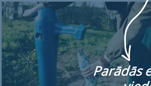
*Rīgas ūdens* publiskais brīvkrāns

Vasarā, kad laiks kļūst siltāks, ir būtiski uzņemt pietiekami daudz šķidruma, lai izvairītos no organisma atdehošanās. Rīgā ir vairāki publiskie dzeramā ūdens